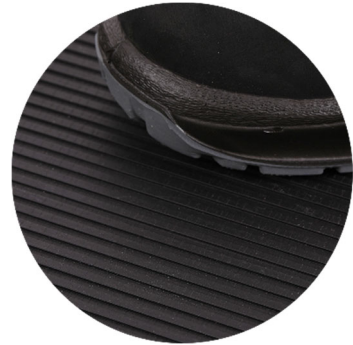
G1302 Breitriefenmatte schwarz