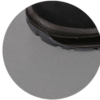
G1301 Feinriefenmatte grau