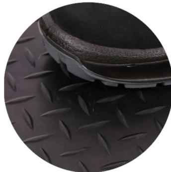
G1306 Riffelblechmatte schwarz